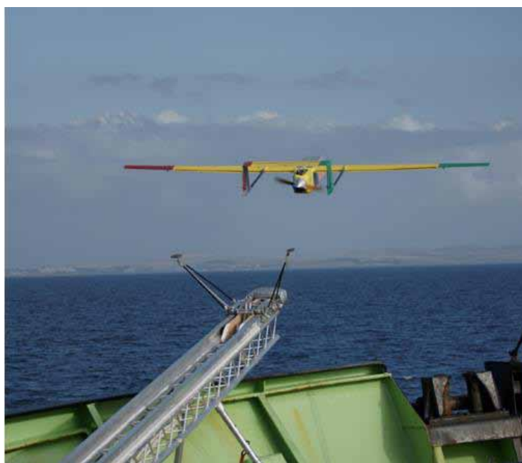
Рисунок 2 — БПЛА типа NOCS, тестируемого для применения в рыбопромысловых исследованиях

К особенностям систем последнего типа можно отнести необходимость установки на борту судна пускового оборудования (Рисунок 2), а также трудоемкость процедуры завершения полета: летательный аппарат опускается на воду, где его приходится вылавливать сетью и принимать на борт при помощи подъемного устройства.