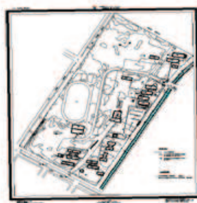
Топографический план на основе данных БПЛА, кампус Мочис, Мексика