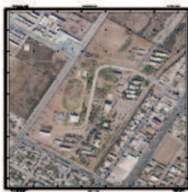
Ортофотоплан на основе данных БПЛА, кампус Мочис, Мексика